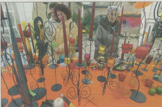
Sur les pavés de la Grand-Rue, des stands gorgés d'idées de cadeaux. Et l'an prochain, c'est partie remise.